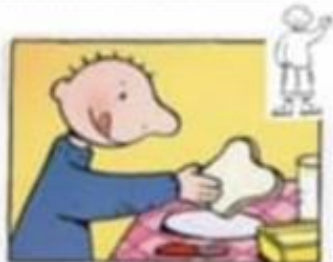
Smeer zelf je boterhammen.