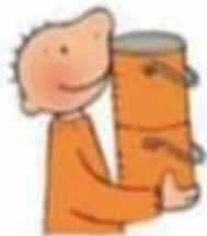
Zoek 5 oranje voorwerpen.