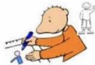
Maak een mooie tekening en stuur ze op naar iemand die je mist.