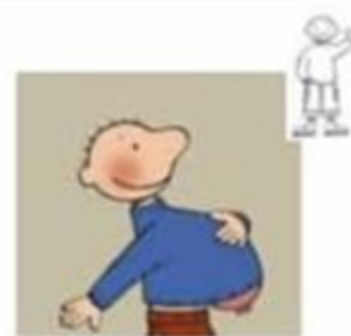
Spelen met ballonnen.