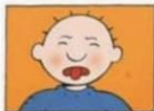
Stuur een zotte selfie in de groep.