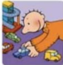
Spelen met de auto's.