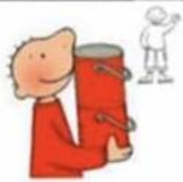
Zoek 5 rode voorwerpen.