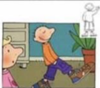
Wandelen in de schoenen van mama of papa.