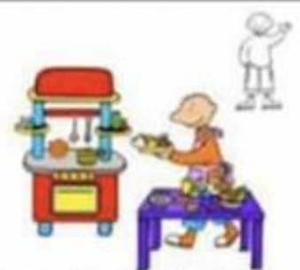
Mama of papa helpen koken.