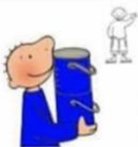
Zoek 5 blauwe voorwerpen