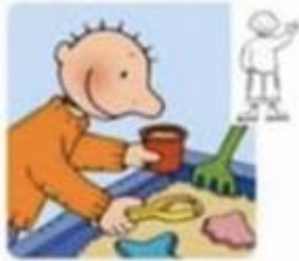
Spelen in de zandbak/plasticine.